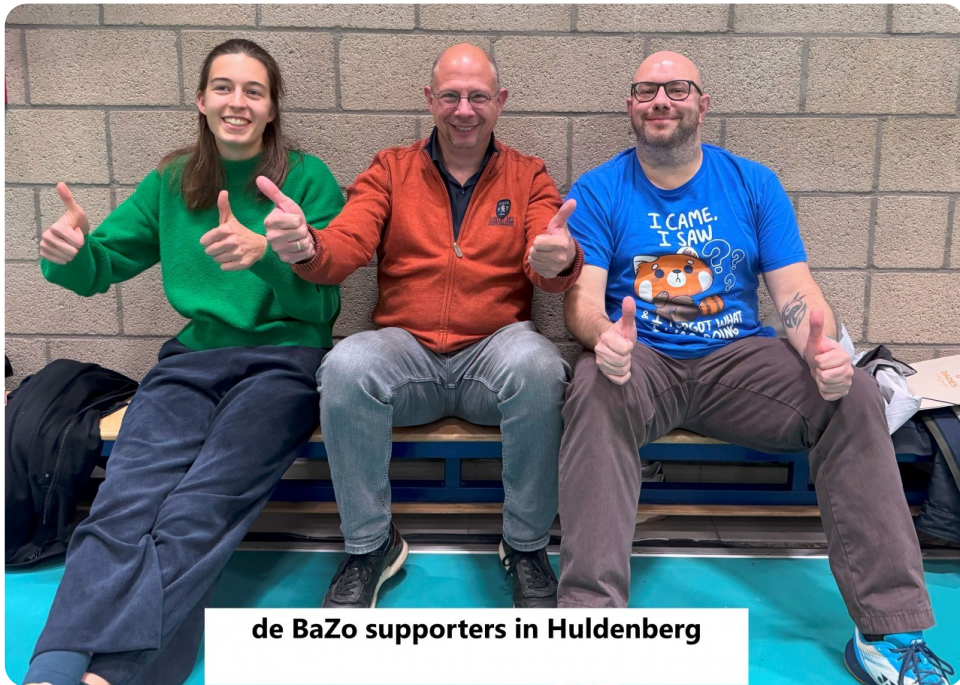
de BaZo supporters in Huldenberg